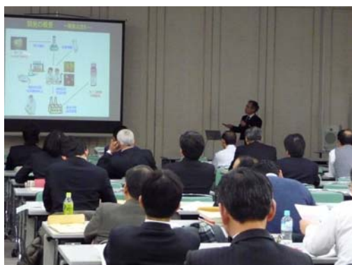
産学連携事例発表