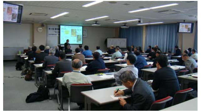
セミナー会場の様子