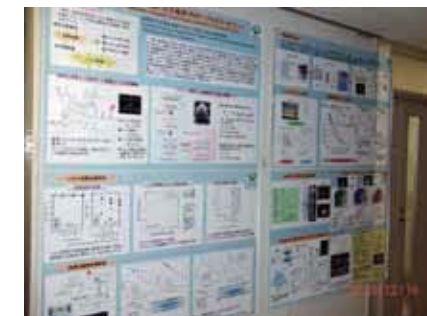
研究室入り口のポスター

私たちの体は80%以上が水であり、水の管理は生命維持に欠かすことはできません。また社会としてみた場合にも水資源の確保と有効利用は21世紀の大きな課題といわれています。私たちはこの課題に従来法とは違う、高電圧パルスという手法で新しい解を提案しようとしています。