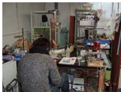
パルス電源と実験風景

するため、この現象を殺菌に利用することも可能です。また放電プラズマにより溶存有機物の分解など水処理への応用も期待できます。