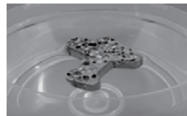
水に浮くほど軽量なポーラスアルミニウム

私たちの身の回りには、木材や生体骨など沢山の多孔質(ポーラス)構造があります。ポーラス構造にすることで軽量化と高強度化の両立など多くの利点を生み出しています。アルミニウム中に多くの気孔を発生させたポーラスアルミニウムは、水に浮くほど軽量で、更に吸音性やエネルギー吸収特性に優れています。例えば、自動車部材へ適用すると、燃費(CO 2 排出量削減)・衝突安全性・防音性の向上といった要求を一つの素材で同時に満たすことができます。そのため、多くの分野で注目されています。このように軽量で多機能なポーラスアルミニウムを、アルミニウムの粉末・板材・浴湯から作製する技術を開発し、新たな軽量で高性能な金属素材を創製するとともに、そのユニークな力学特性(圧縮・引張・曲げ・衝撃)の評価も行っています。