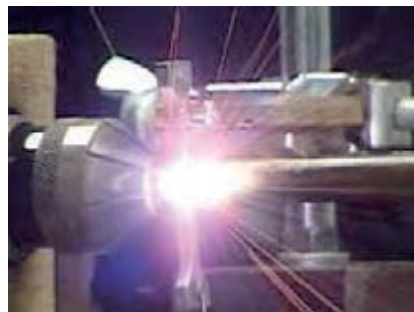
傾斜機能材料の耐熱性を調べる実験

スペースシャトルが大気圏に再突入する際には、翼の前縁部分は数千℃の高温に晒されます。この時、同時に翼は激しく上下に振動します。したがって、スペースシャトルのような宇宙往還機の翼に使用される材料には、耐熱性と延性(材料の粘り強さ)が要求されます。これを可能とする材料