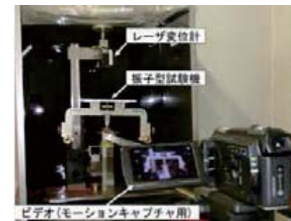
ハーバート硬さ試験の様子

す。試料が柔らかいほど試料が変形し易く、試料の変形により圧子の転がり抵抗が高くなるので、対数減衰率も高くなります。対数減衰率を利用して試料の硬さを評価します。当研究室ではハーバート硬さ試験機の測定精度を向上させるため、試験機の角度を正確に検出する方法等について研究しています。現在は、測定精度の高い2つのレーザ変位計を用いる角度検出および持ち運び性に利のあるモーシオンキャプチャを用いる角度検出に注目しています。