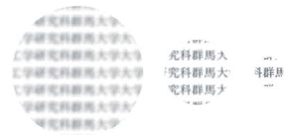
「小さな文字を見ますと、ピントは合っていますが見える範囲は狭まります。逆に、大きな領域を見ますと、ピントは外れていますが見える範囲は広がります」

見る場合には合焦点像に近い状態までピントを合わせますが、壁などの模様についてはかなり大きな平面領域を見る場合にはかなりピントが外れてぼけた網膜像になります。これが、カメラのオートフォーカス機構とは異なる点です。一方、網膜内には、網膜像の光信号を生体電気信号に変換する視細胞が不均一に並んでいます。光軸中心部（中心窩）では非常に多くの視細胞が並んでいますので小さな文字も見えますが、周辺に行くほど視細胞の数は急激に減少しますので小さな文字はぼけて見えなくなります。従いまして、小さな文字を見る場合には、網膜像のピント状態は合焦点状態に近くなりますが明確に見える範囲（視野）はかなり狭くなり、模様のない大きめの平面領域を見る場合には、網膜像はピンボケ状態ですがこのピンボケ画像の見える範囲は広がります。これは、網膜像のピント状態を改善すればはっきり見える範囲（視野）が狭くなり、ピント状態を悪化させれば見える範囲（視野）が広がるという、ピント状態と視野の間の一種の不確定性の関係（トレードオフの関係）を意味します。したがって、はっきりとした小さな文字を広範囲にわたって見ることはできません。この特性は、脳の情報処理能力に限界があるためと考えられます。