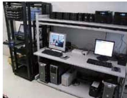
研究室内のクラスタ計算機

ASTERの全面像を対象とする雲量データベースを構築しており、その情報は、日々、日米政府のASTERデータ配布機関に転送され、活用されています(受託研究として実施)。