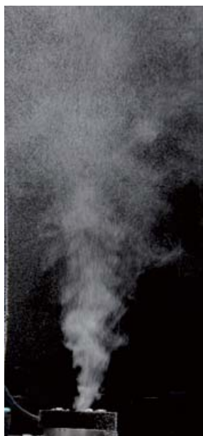
図1. 微細気泡発生装置MiBosを用いた水中への空気の微細気泡化

を供給するだけで微細化できます。ガスを無駄にせず効率的に利用できるのが特徴です。水に難溶性のガスを液体中に効率よく供給する装置といえます。