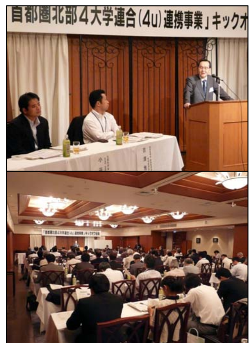
8月22日 キックオフミーティング開催

今後5年間継続する本プロジェクトを実りあるものとするために、産学官の皆様のご協力とご支援を心からお願い申し上げます。